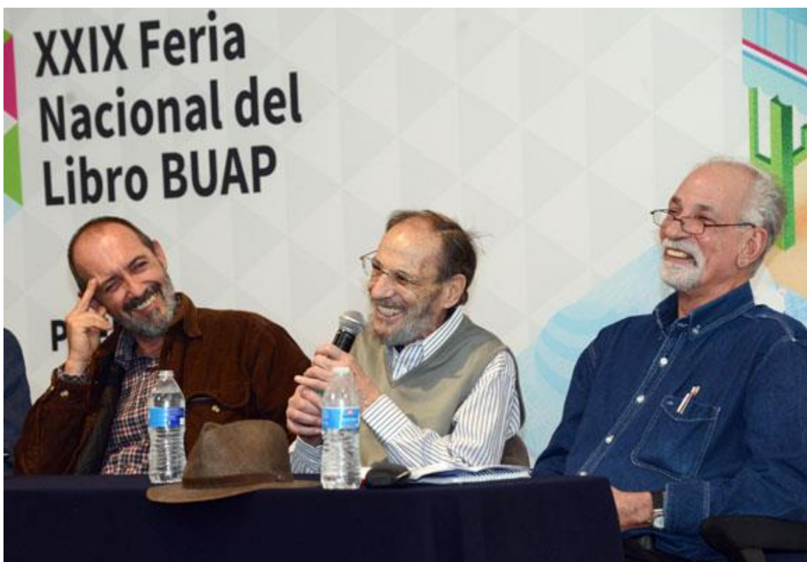
Fig.2. Fotografía de Abraham Paredes, La Jornada de Oriente (20 de marzo de 2016)

contemporánea como de la evaluación que distintos sectores sociales propagan sobre estos cambios, se muestra que la reflexión sobre la lectura no ha estado a la altura de las nuevas demandas de la escritura, esto es, de los diversos tipos de lectura que son requeridos. De aquí que, analizando las manifestaciones contemporáneas de la escritura, Raúl Dorra ha postulado la necesidad de concebir una semiótica de la lectura que dé cuenta de las transformaciones de la propia escritura y del lugar que el libro está llamado a ocupar en el seno de esas transformaciones.